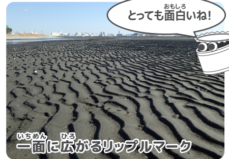
とっても面白いね!

たまに工作のワークショップを担当します。工作が好きで、最近は種本や押し花を使ってレジンストラップを作ったりしています。